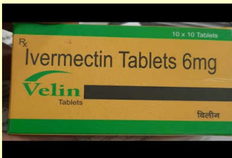
Foto: Proč Indie, "země parazitárních onemocnění", jako jedna z prvních schválila Ivermectin jako lék proti COVID-19?

Viz: COVIDgate: It's obviously a parasite, not a coronavirus. (COVIDGATE: Je to evidentně parazit, nikoli virus.)