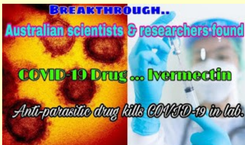
Foto: Průlom: australské vědci a badatelé našli lék proti COVIDu-19 ... Ivermectin.

Co dál? Mezi parazitem a virem je OBROVSKÝ rozdíl. A bioinženýři to věděli: proto je detailně zkonstruovaná tajná biologická zbraň Covid tak extrémně nebezpečná.